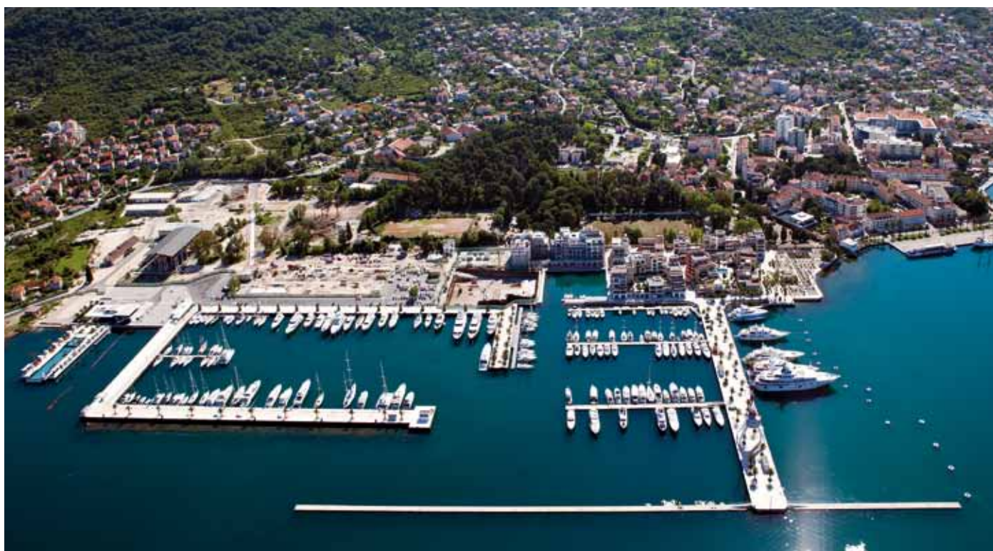
Porto Montenegro - Tivat, Montenegro

delle proposte e le innovazioni progettuali della società: pontili tipo all concrete sono in fase di installazione nel porto storico di Montecarlo nel Principato di Monaco, maxi frangionde galleggianti a Port Gocek in Turchia, pontili in alluminio della nuova serie heavy duty per Ayla Marina in Giordania e per alcune basi della Guardia Costiera dell'Arabia Saudita. Un momento, per Ingemar, di nuove entusiasmanti avventure nelle acque del Mediterraneo, del Mar Rosso e del Golfo Persico, contrassegnato da ottimismo e dalla speranza che il settore nautico italiano torni presto a ricevere le meritate attenzioni e i giusti riconoscimenti, frutto della nostra tradizione marinara e della qualità del Made in Italy.